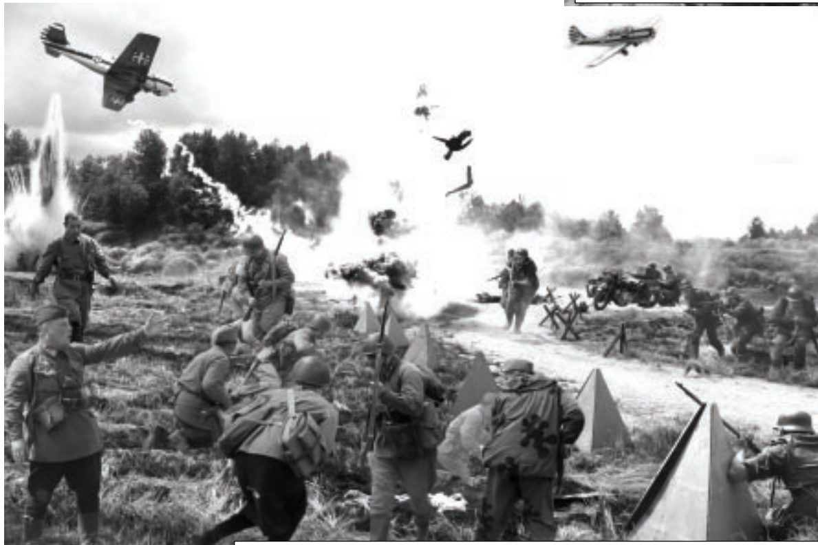
Реконструкция боёв за Соловьёву переправу жарким летом 1941 года

С 18 по 20 июля в Кардымовском районе на берегу реки Днепр проходил международный туристический фестиваль «Соловьёва переправа». В нем приняла участие и команда Ярцевского района.