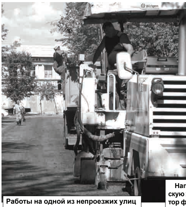
Работы на одной из непроезжих улиц нашего города - улице Луначарского

Дорожники фрезеруют сразу все участки, на которые будет наноситься асфальт. Такой порядок ведения работ обусловлен тем, что фреза - агрегат дефицитный, в ней нуждаются дорожники других районов области, поэтому график её